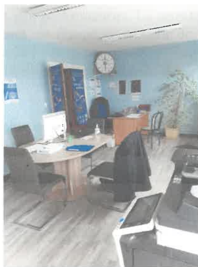
Siège social à Salbris