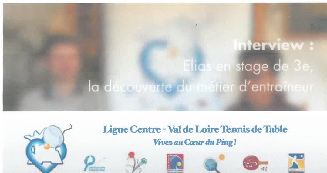
Photo de la vidéo de l'interview