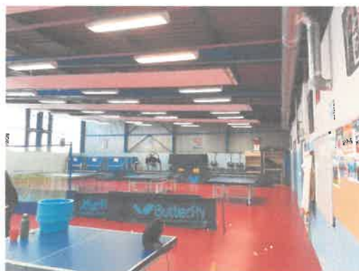
Structure d'entraînement à Tours

Les clubs et la fédération de Tennis de Table constituent la Ligue, et des bénévoles la dirigent avec un président. La nature de cette association est une association de services dans le sport (tennis de table). Le budget de l'association est d'environ de 600 000 euros, et d'après l'effectif du nombre de salariés (4), elle est classée comme une petite entreprise. Le principal fournisseur est Butterfly pour le matériel de tennis de table. La ligue n'a pas de client, mais elle a des usagers, comme les clubs, les adhérents, les licenciés, les bénévoles, les dirigeants. Les matériels utilisés