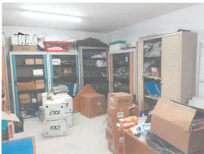
Le stock de matériel