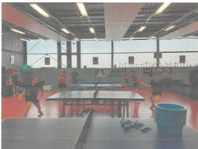
Entraînement à Tours