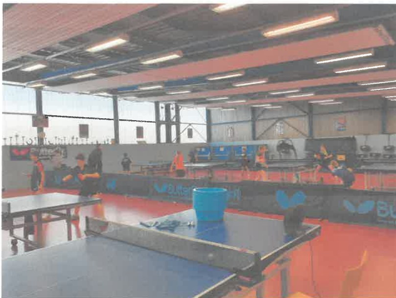
Entraînement à Tours

J'ai assisté à un entraînement des meilleurs joueurs, âgés de 11 à 14 ans. C'est un entraînement de haut niveau, où les joueurs sont précis, ont une bonne technique et font des enchaînements rapides.