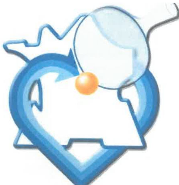
Logo de la ligue du Centre-Val de Loire de Tennis de Table

Je devais faire mon stage au club de Bourges avec un entraîneur professionnel que je connais bien. J'avais envoyé une lettre de motivation au président du club et le comité directeur avait accepté. Mais avec les dernières annonces du gouvernement qui suspendaient tous les entraînements en salle, mon stage a dû être annulé. Le président de mon club à Vierzon, travaille à la Ligue régionale de tennis de table. Je lui ai donc demandé si je pouvais faire mon stage avec lui. Il a tout de suite accepté, ce qui m'a permis de rencontrer plusieurs personnes et différents métiers dans le tennis de table.